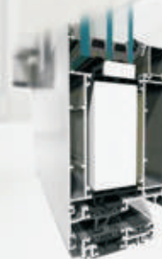
system okienny MB-86 Aero system drzwiowy