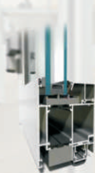
system okienny MB-86 ST system drzwiowy

System okienny-drzwiowy o bardzo dobrych parametrach, dający możliwość zaspokojenia różnorodnych potrzeb użytkowników. Konstrukcja jego kształtowników posiada 3 warianty wykonania w zależności od wymagań oszczędności energii cieplnej: ST, SI i AERO. MB-86 to pierwszy na świecie system aluminiowych okien drzwi, w którym zastosowany został aerożel - materiał o doskonałej izolacyjności termicznej. Do zalet systemu MB-86 należy także wysoka wytrzymałość profili, umożliwiającą wykonywanie konstrukcji o dużych gabarytach i ciężarze.