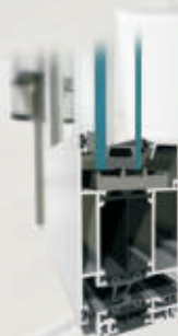
system okienny MB-86 SI system drzwiowy